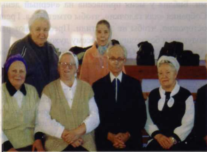
На фотографии основатели церкви. В настоящее время эта церковь возросла до 500 членов.