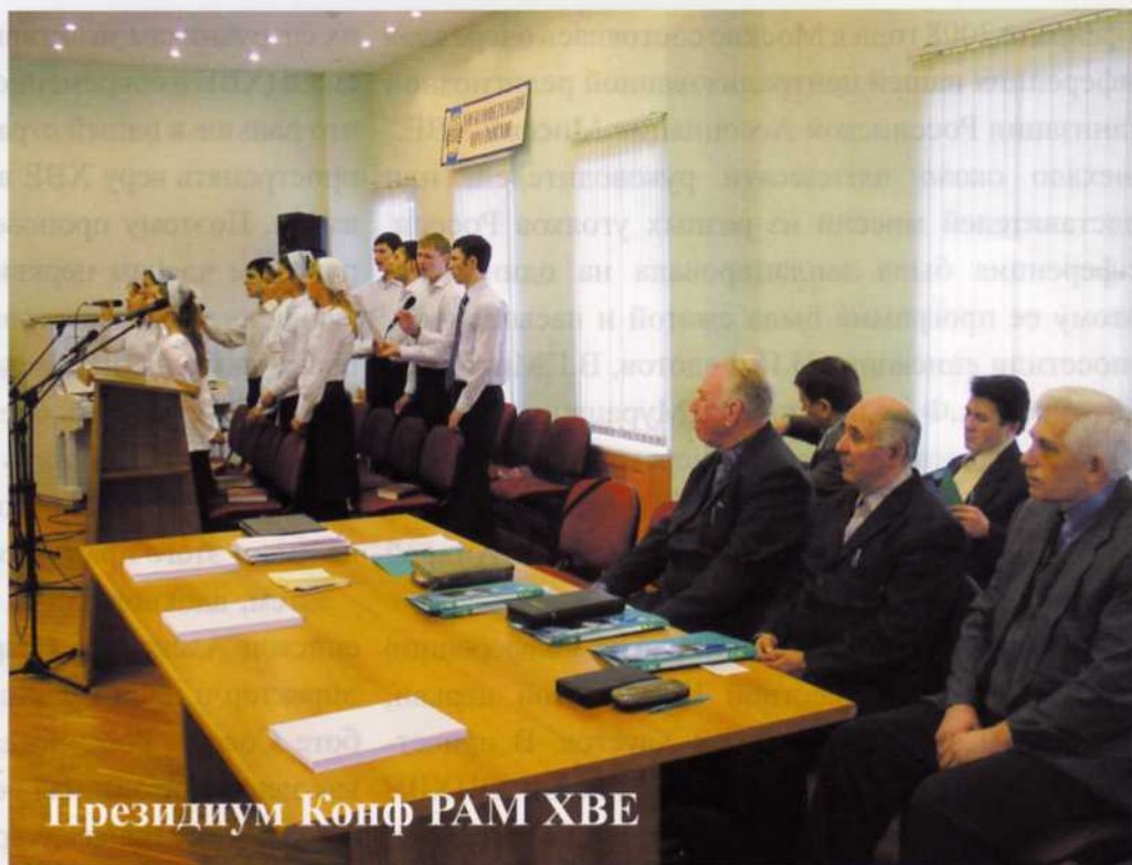
Президиум Конф РАМ ХВЕ